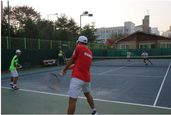
男子試合中の様子