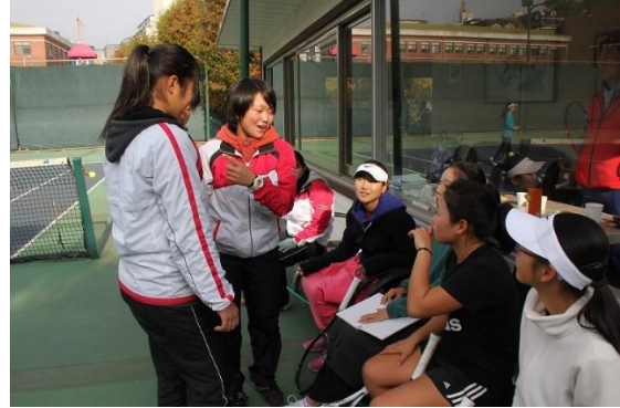
韓国選手との交流の様子