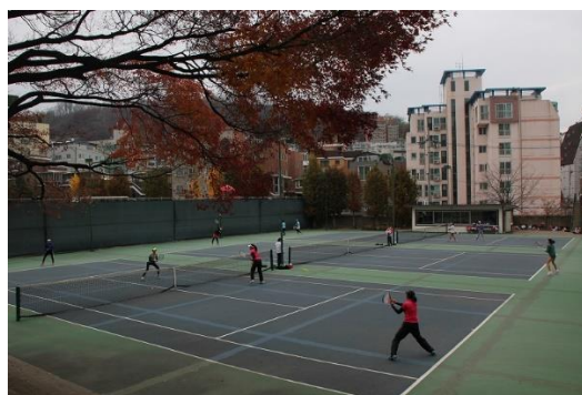
女子試合中の様子