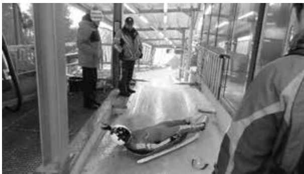
2019年リ्यूージュ ドイツ合宿