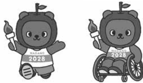
第82回国民スポーツ大会・第27回全国障害者スポーツ大会 マスコットキャラクター 長野県PRキャラクター「アルクマ」 ©長野県アルクマ