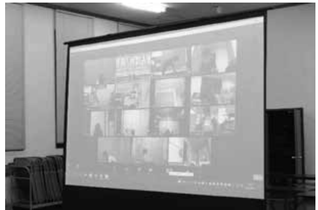
オンラインでのトレーニング