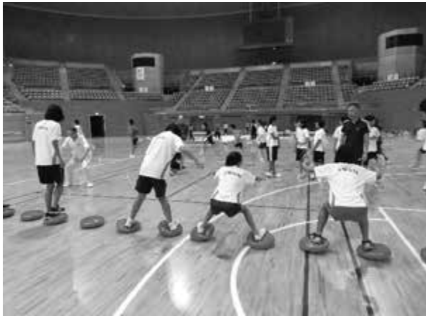
フィジカルトレーニング

特に、SWANの理念である「冬季オリンピックでのメダリストの輩出」については、2022年（令和4年）に中国北京で開催された冬季オリンピックにSWAN修了者から初のオリンピック出場者が3名誕生した。今後、オリンピックメダリストの輩出に向け、さらに高みを目指し、魅力あるSWANへと発展させていきたい。