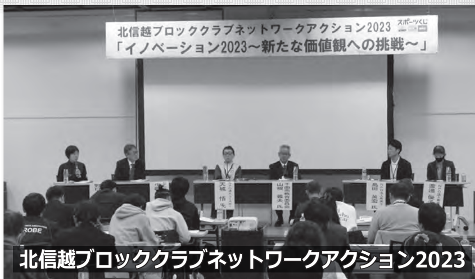
北信越ブロッククラブネットワークアクション2023

今年度、表記大会が11月18日(土)・19日(日)に長野市生涯学習センター (TOiGO) にて開催されました。コロナ禍明けの初の参集開催ということで、各県から参加者総勢104名を迎えることができました。