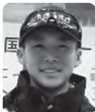
ノルディック コンバインド