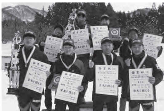
クロスリレーアベック優勝

今年度も部活動に限らず、中学生のスポーツ活動に携わる競技団体、体育・スポーツ協会、指導者、選手をサポート・応援して下さった多くの皆様に衷心より御礼申し上げ、1年間のまとめといたします。