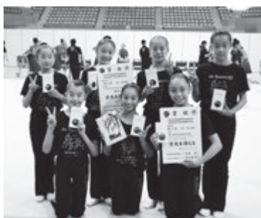
新体操団体2位 赤穂中学校