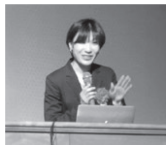
酒井裕唯氏による記念講演