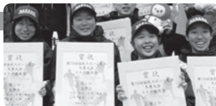
クロスカンツリーリレー 4×5km 女子