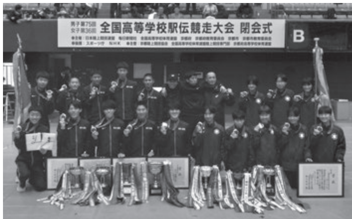
全国高校駅伝