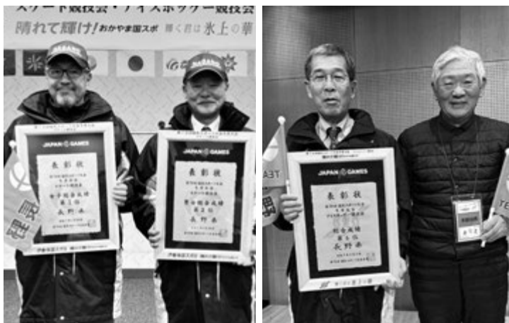
スケート・アイスホッケー競技会