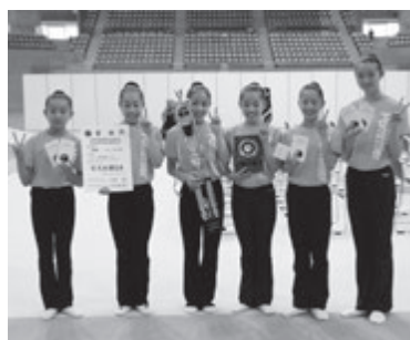
新体操団体優勝 ポミエ新体操クラブ

今年度も部活動に限らず、中学生のスポーツ活動に携わる競技団体、体育・スポーツ協会、指導者、選手をサポート・応援して下さった多くの皆様に衷心より御礼申し上げます、1年間のまとめとします。