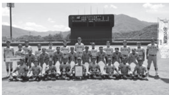
軟式野球2位 佐久長聖中学校