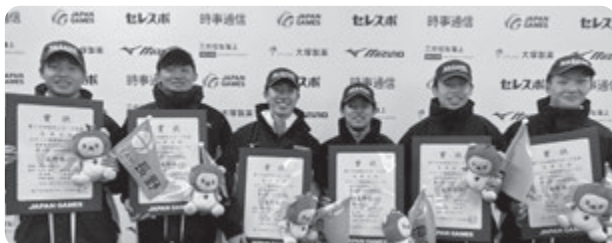
スピード 成年男子2000mリレー